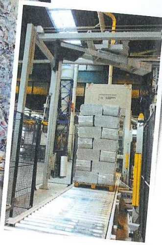
L'usine de papier Norske Skog d'Épinal.

La ouate conditionnée en partance pour les chantiers.