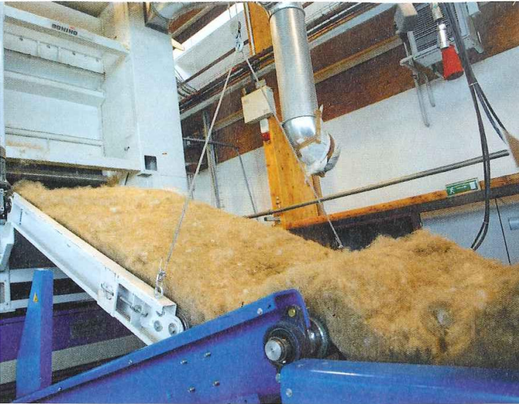
Ligne de fabrication d'échantillon de 1 m x 30 cm de mélange de fibres nappés, avec traitement ignifuge et antifongique. Les différents modes de traitement sont testés (imprégnation, enduction et pulvérisation). Les tests permettent d'améliorer les procédés des industriels et limiter les pertes lors de la fabrication. Le but des recherches est d'éliminer tout produit issu de la pétrochimie pour lier les fibres.

Le laboratoire possède toutes les machines pour tester les caractéristiques thermiques des fibres.